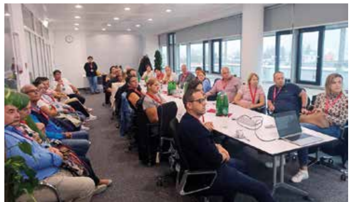
Prezentáció az INFINEON nevű cégnél