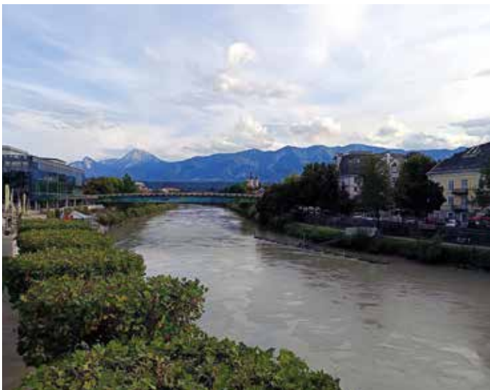
A Dráva folyó Villach-ban