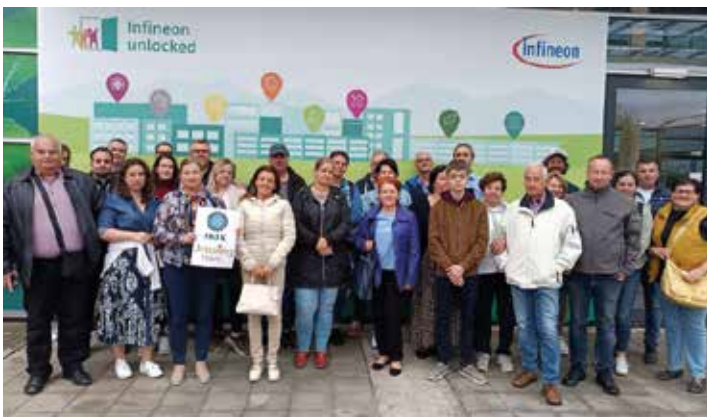
Csoportkép az INFINEON Villach-i üzeme előtt

A program a Nemzetgazdasági Minisztérium támogatásával valósult meg.