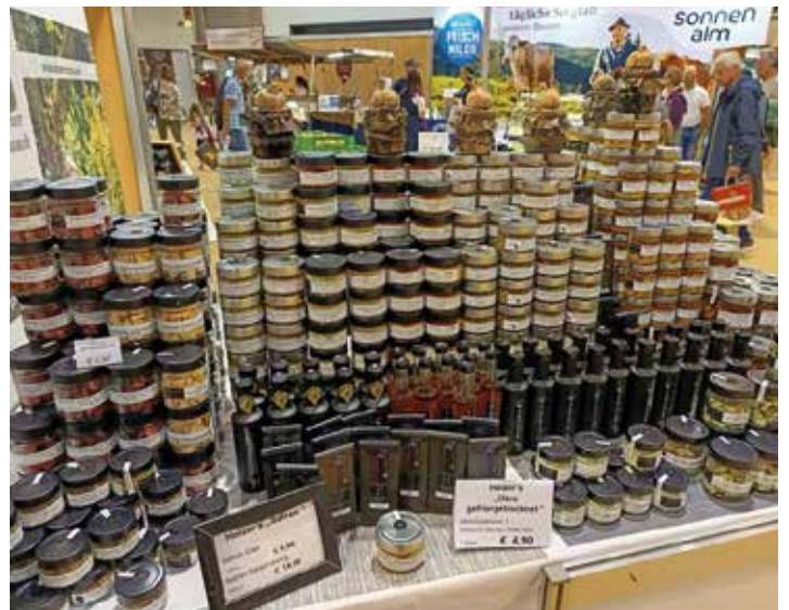
Fekete fokhagyma és más érdekes termékek az egészség jegyében